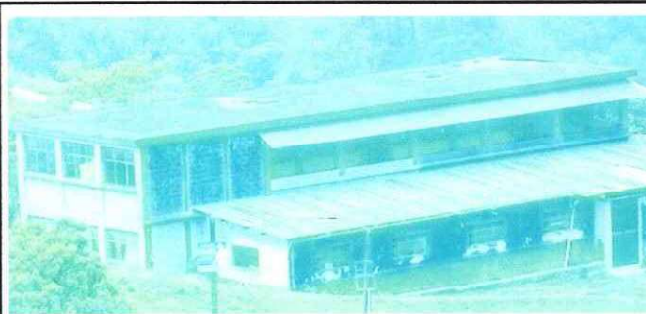
Foto 4: Impermeabilización de losa: la losa del segundo piso del edificio no recibe mantenimiento hace más de 10 años; hay acumulación de residuos de polvo y deterioro del impermeabilizante.