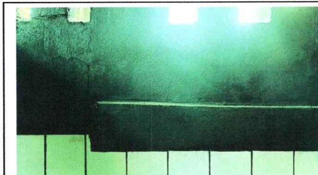
Foto 3: Reparación o sustitución de área de cocina: se tienen 45 metros cuadrados de reparación de cerámico en la cocina ya que debido al calor, el humo y la falta de mantenimiento se han desprendido de las paredes.