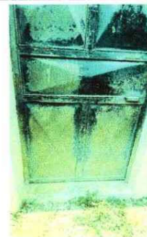
Foto 2: Puertas: se tienen 2 puertas en mal estado que necesitan reparación, 11 puertas que requieren pintura y dos cambios de chapas ya que están en mal estado.