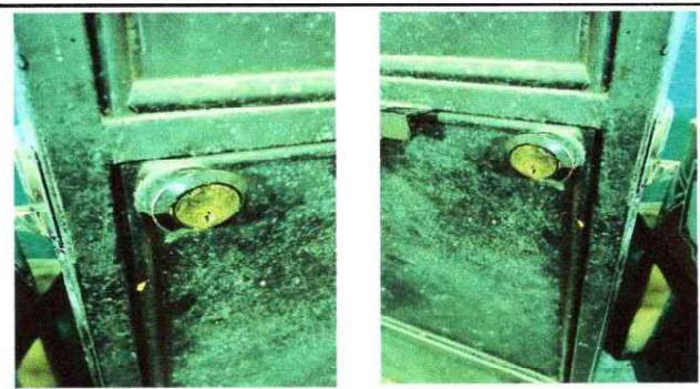
Foto 6: Cambio de 2 chapas: 1 de la puerta de la cocina y 1 de la puerta de una de las aulas.

Observación: Si es necesario se pueden agregar hojas adicionales y actualizar el número de hojas.