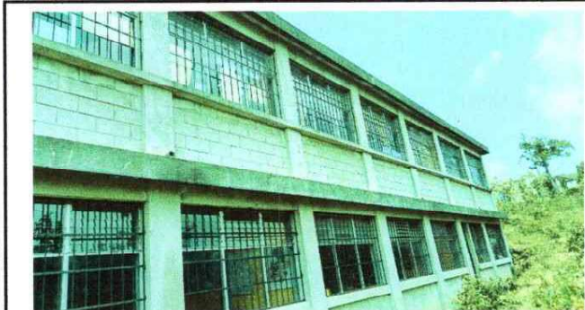
Foto1: Cernido de paredes: se tiene 350 metros cuadrados de paredes que en su mayor parte no cuentan con cernido y que con el paso del tiempo puede deteriorar las paredes de los salones de clases.